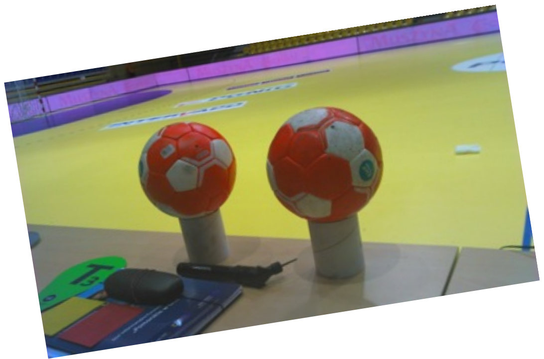
nowiutkie piłki gotowe do gry