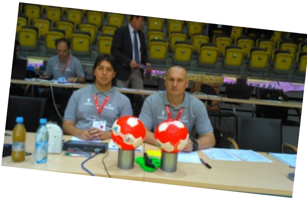
załoga stolika ;)